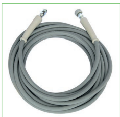
10 m hogedrukslang (3/8") code: 1.653.020