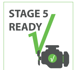
Alle motoren voldoen aan de recentste uitstootnorm