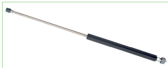
Enkele RVS spuitlans met hogedruksproeier en snelkoppeling 1.216.729.xxxx