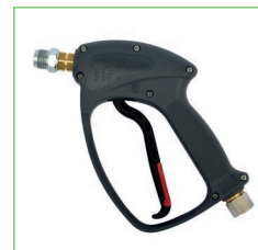
Hogedrukpistool met swivel code: 1.211.525