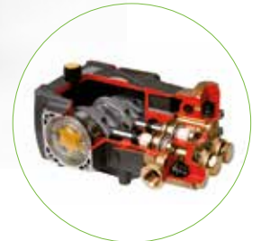
Radiale krukaspomp met messing pompkop, keramische plunjers en RVS kleppen