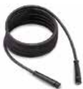
Hogedrukslang 10 m met draaikoppeling. 315 bar, 150°C 3.8007.TBAP25324

Hoogwaardige componenten die makkelijk bereikbaar zijn dankzij de modulaire opbouw