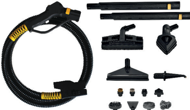
JULY 6 BAR Stoom 165°C