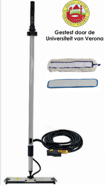
STOOM MOP Stoom 165°C