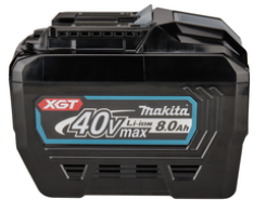
191X65-8 Accu BL4080F XGT 40V Max 8,0Ah