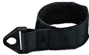
166116-2 Bevestigingsband rugstofzuiger