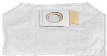
197903-8 Fleece stofzak 2l rugstofzuiger