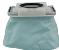
197899-3 Linnen stofzak 1,5l rugstofzuiger